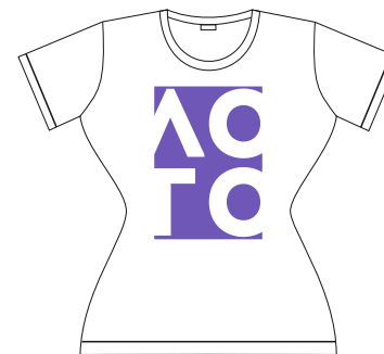
L, XL, 2XL